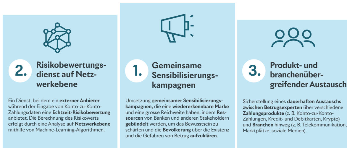
Abbildung 2: Empfohlene Massnahmen aus der SBVg

Basierend auf den Erkenntnissen aus der durchgeführten Vorstudie empfehlen wir der Schweizer Finanzbranche, die folgenden drei Massnahmen weiterzuverfolgen: